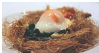
Este plato de comida emula un nido con huevo y todo, que combina lo sencillo con lo gourmet.

museólogo, naturalista y profesor de la Cátedra Unesco de Buenos Aires. "Su inclusión aportaría algo inédito: que las áreas protegidas no prioricen sólo la naturaleza sino también expresiones culturales. Si en un paisaje ambas partes del patrimonio están integradas, ¿por qué disociarlas cuando tenemos que protegerlas? Después de todo, así lo hacen otros países cuyos parques nacionales no sólo tienen foco en lo natural, sino también en lo histórico, lo arqueológico, lo artístico... es decir, protegen el patrimonio de forma integral."